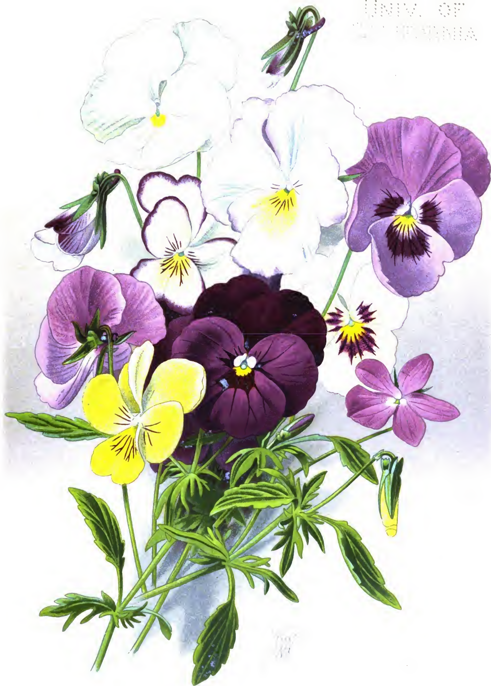
Viola cornuta hybrida.